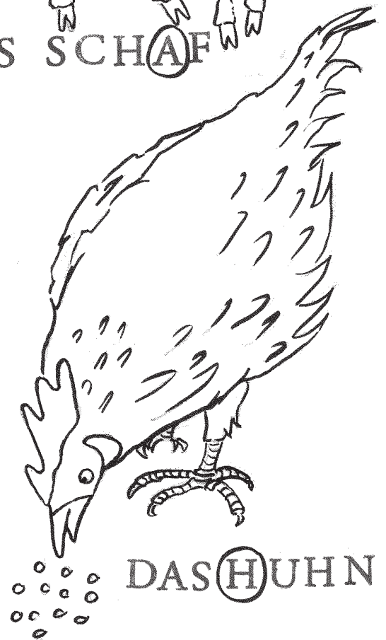
DAS HUH N